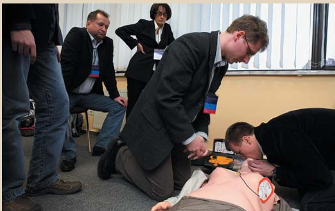
Fot. 5. Szkolenie firmy Medtronic z podstawowych zabiegów ratowania życia