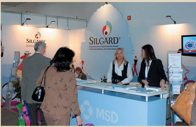
Fot. 7. Stoiska partnerów Kongresu – firmy MSD Polska oraz Polfarmex