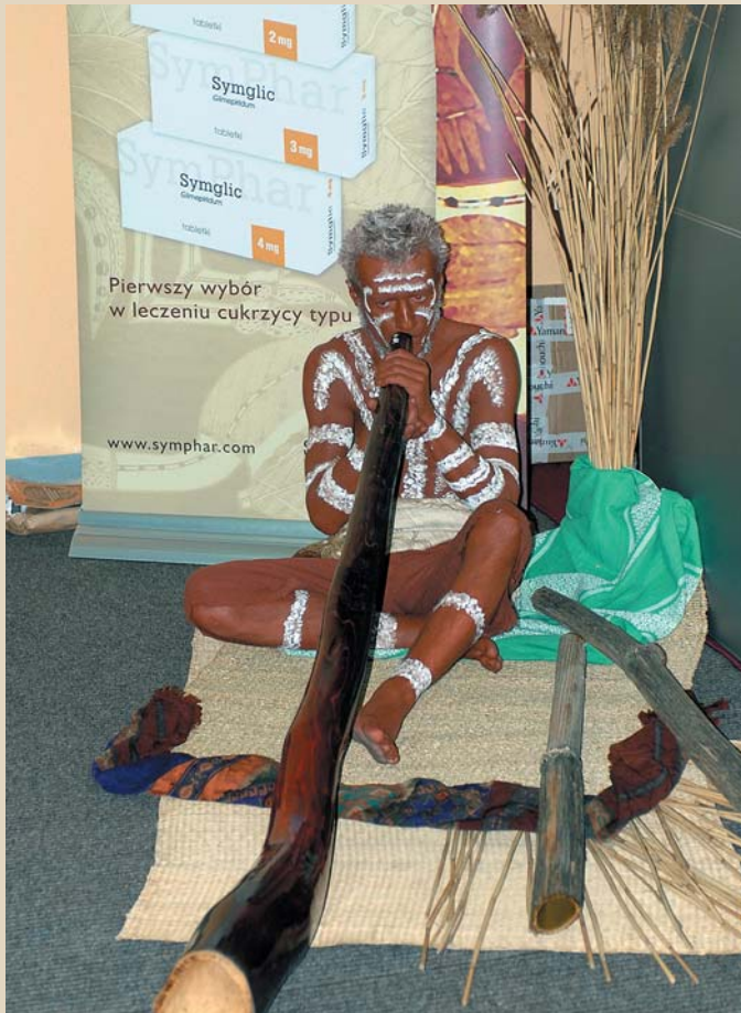
Fot. 8. Wystawa firm farmaceutycznych