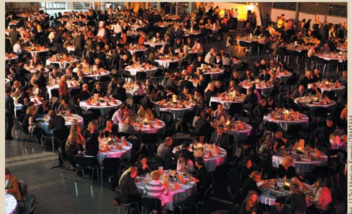
Fot. 10. Po trudach wykładów Biesiada z Żukami