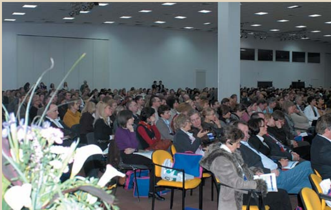
Fot. 1. Uczestnicy szczerze wypełniali Salę Kongresową

Pierwszy ogólnopolski Kongres Top Medical Trends zgromadził ponad 2,2 tys. lekarzy. W ciągu trzech dni Kongresu mieli oni okazję wysłuchać 48 wykładowców, którzy przeprowadzili prelekcje podczas 23 sesji tematycznych. Wykłady przedstawiło m.in. 5 konsultantów krajowych i 9 szefów towarzystw naukowych. Kongres umożliwił zgromadzonym lekarzom zapoznanie się w skondensowanej formie z najnowszymi osiągnięciami medycyny, pochodzącymi ze światowych i krajowych kongresów, w dodatku zaprezentowanymi w formie autorskiego wyboru przez najlepszych, najciekawiej prezentujących tematy naukowców-praktyków. Drugą nowością było organizowanie po każdej sesji, w osobnych salach, dyskusji wykładowców z uczestnikami.