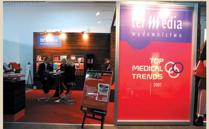
Fot. 9. Stoisko organizatora – Wydawnictwa Termedia