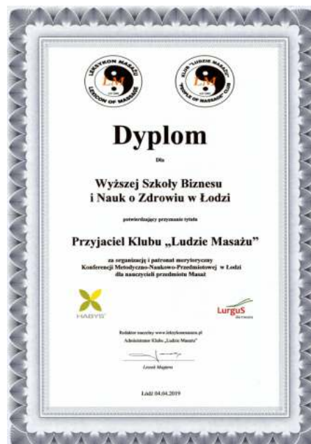
Ryc. 4. Statuetka i dyplom dla Wyższej Szkoły Biznesu i Nauk o Zdrowiu z Łodzi [11,12]