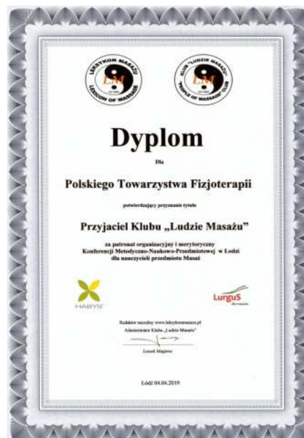
Ryc. 5. Statuetka i dyplom dla Polskiego Towarzystwa Fizjoterapii z siedzibą w Pabianicach [11,12]

Masseur” został uhonorowany Art Riggs - amerykański Certyfikowany Masażysta, Certyfikowany Zaawansowany Rolfer®, nauczyciel masażu, autor książek i publikacji z zakresu masażu tkanek głębokich [3,8].