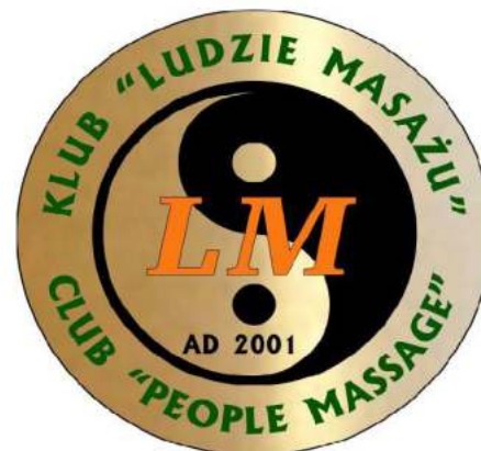
Ryc. 1. Legitymacja i odznaka członka Klubu „Ludzie Masażu” [3,5]

Legenda”, który kreuje określony styl masażu,