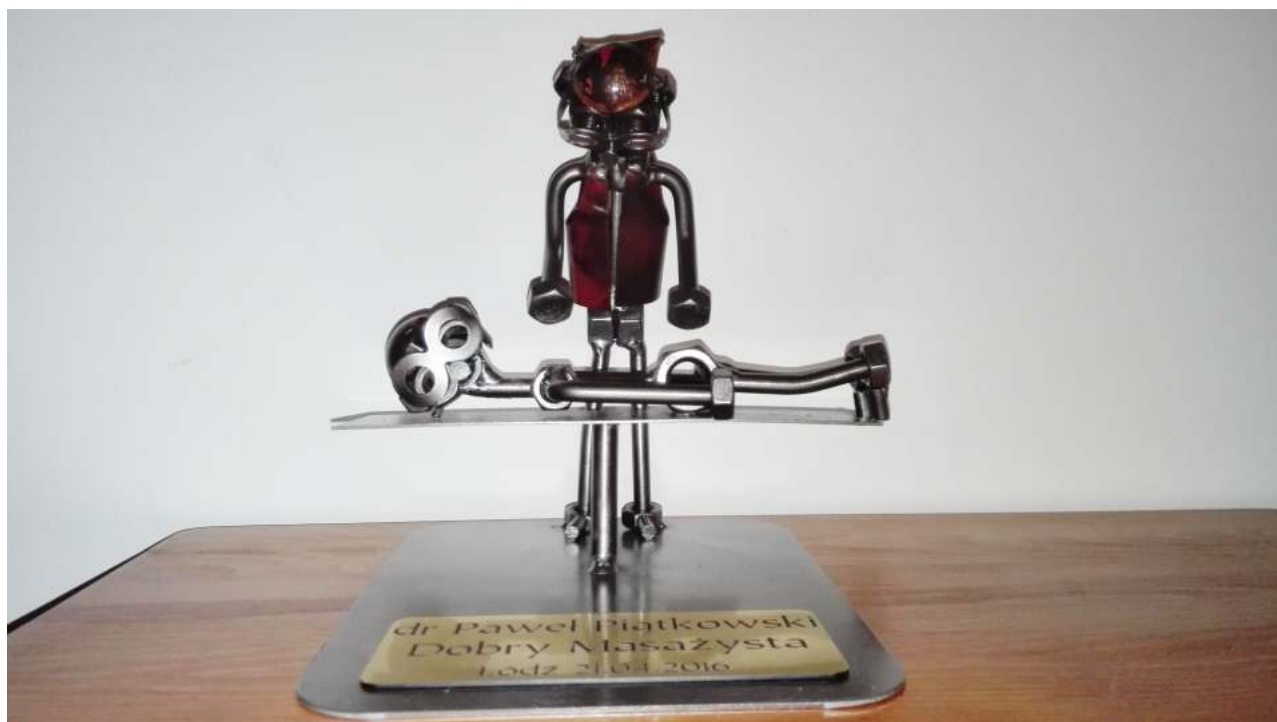
Ryc. 2. Statuetka „Dobra Masażystka/Dobry Masażysta” [3,6]