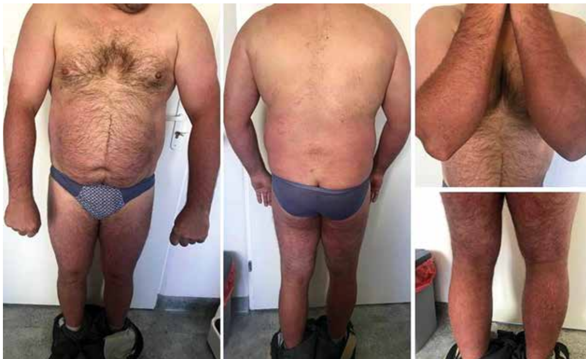
Figure 3. A complete remission of psoriatic lesions in the 16 th week of therapy with risankizumab

Rycina 3. Całkowita remisja zmian łuszczykowych w 16. tygodniu terapii ryzankizumabem