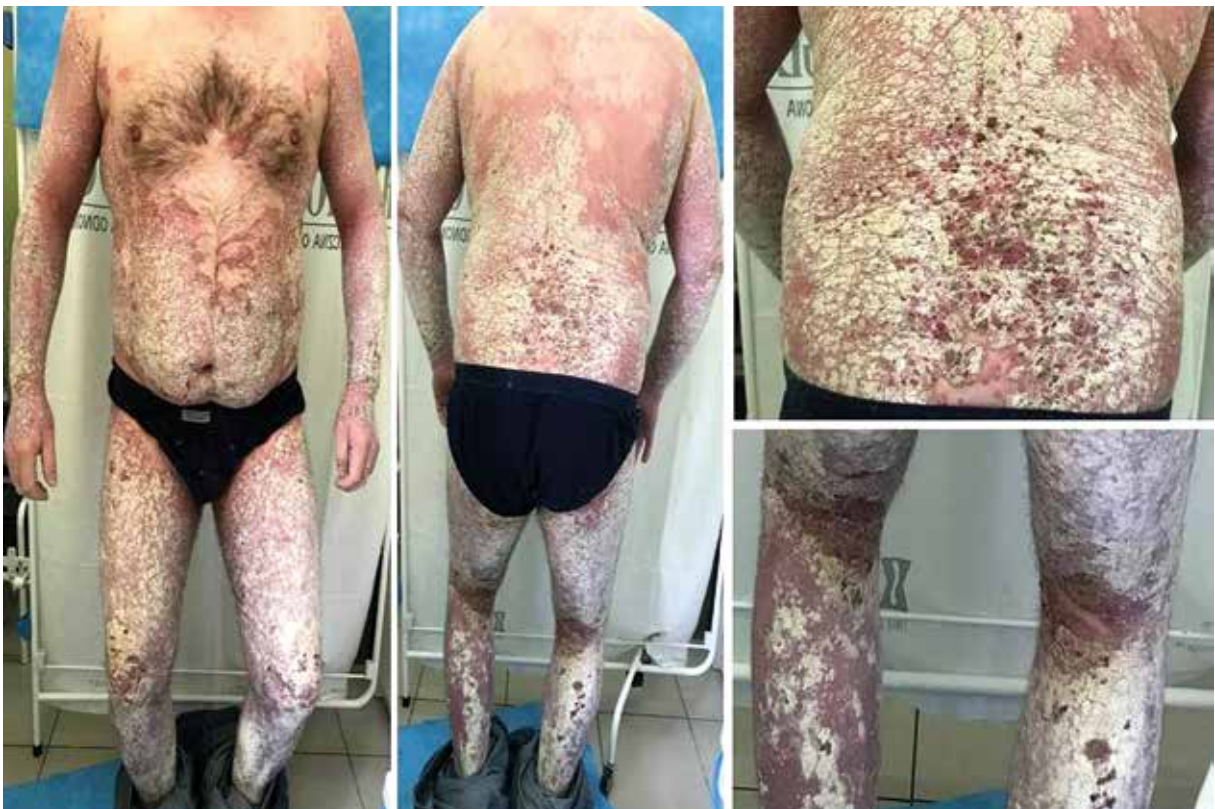
Figure 2. Psoriatic skin lesions after a 16-week therapy with ixekizumab, and before the patient was started on risankizumab

W terapii ogólnej stosowano cyklosporynę A w dawce 4,7 mg/kg m.c. przez 9 miesięcy bez satysfakcjonującej poprawy oraz metotreksat doustnie w dawce 15 mg raz w tygodniu – leczenie przerwano po około 2 miesiącach z powodu działań niepożądanych w postaci silnych bólów brzucha, biegunek oraz podwyższenia aktywności aminotransferaz. Ze względu na ciężki