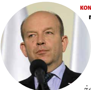
KONSTANTY RADZIWIŁŁ minister zdrowia (w Sejmie)

Wezwania do de facto redukcji pracy w stosunku do pracowników służby zdrowia, zwłaszcza lekarzy, uważam za skandaliczne i haniebne. Odbieram zapowiedzi, że lekarze będą pracować mniej, jako uderzenie w podstawy etyki lekarskiej.