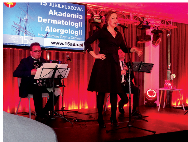
RYCINA 5. Koncert inauguracyjny