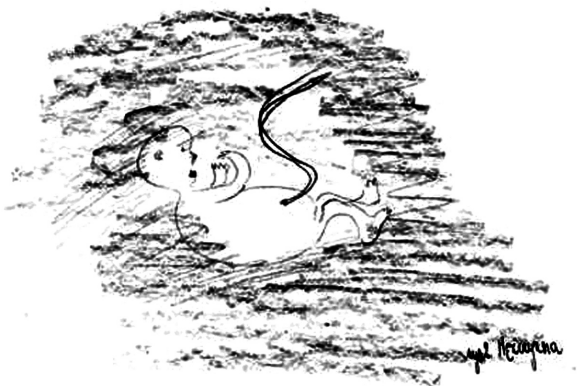
Rycina 3. Figure 3.

opierają się na projekcji rozumianej jako sposób spostrzegania i reagowania na bodźce zewnętrzne, zawsze uwarunkowane cechami osobistymi osoby spostrzegającej. Celem badania projekcyjnego jest uzyskanie wglądu w psychikę człowieka [6].