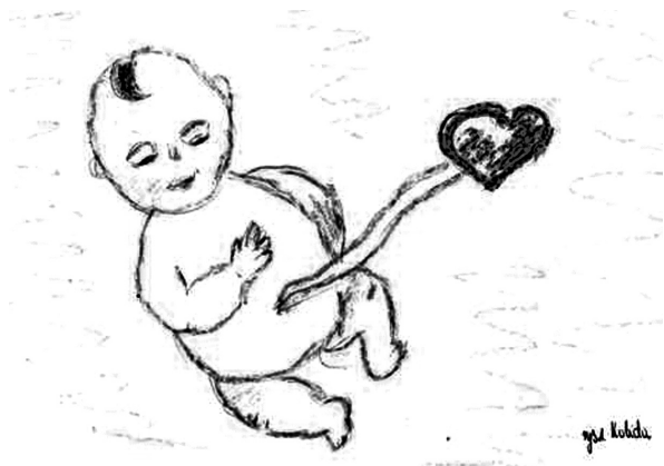
Rycina 2. Figure 2.