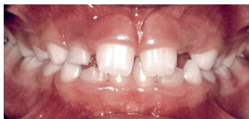
Rycina 1. Charakterystyczne ustawienie zębów siecznych w okresie „brzydkiego kaczątka”.

The statistical analysis was prepared using the Pearson's chi-square ( \chi^2 ) independence test.